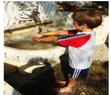
Niño EHS realizando una descarga