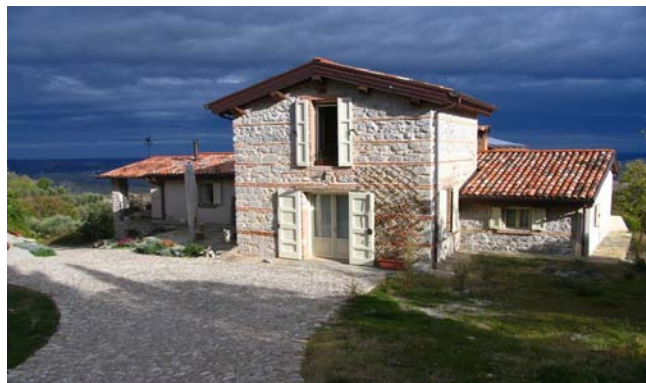
La nueva morada B & B "Jubilación del lobo" (Eremo del Lupo)