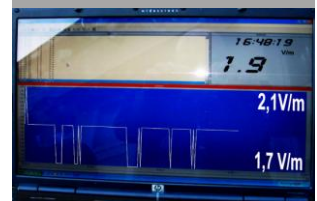
Graphique de mesures non extrapolées école Gerson