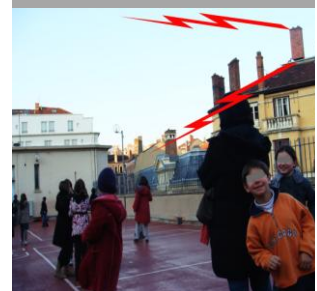
Cour de récréation terrasse de l'école Gerson de Lyon