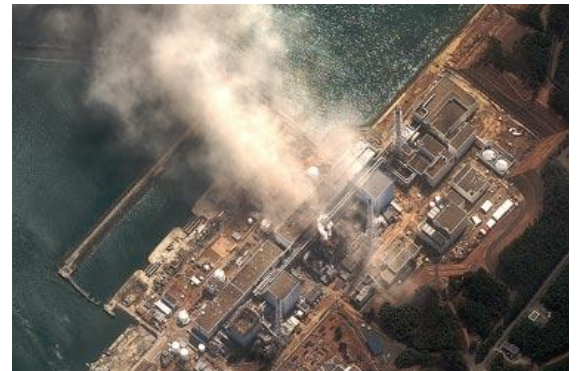
Les fonctionnaires du gouvernement ont lancé une campagne de RP pour s'assurer que la catastrophe nucléaire de Fukushima au Japon n'impactera pas les prévisions de constructions des nouvelles centrales nucléaires au R-U.

Le département des affaires a contacté le 13 mars par courriels les firmes nucléaires et leur organe représentatif l' Association des Industriels du Nucléaire (NIA) soit deux jours après la catastrophe qui a frappé les centrales nucléaires et leurs systèmes de sécurité de secours à Fukushima. Le ministère a soutenu que des images de télévision de l'époque montraient que cela n'était pas grave mais donnait l'impression d'être plus que "spectaculaire", même si les conséquences de l'accident étaient encore en cours et que les trois fortes explosions dans les enceintes des réacteurs ne s'étaient pas encore produites.