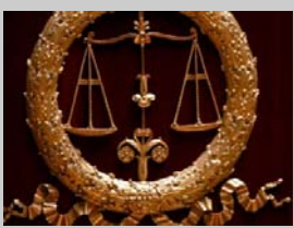
TGI de NANTERRE JUGEMENT

Tribunal de Grande Instance de Nanterre : Riverains antennes relais contre Bouygues Telecom. Extrait Jugement rendu le 18 septembre 2008 (PDF page 4) :