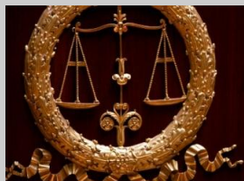
TGI de NANTERRE JUGEMENT

▲ Site à consulter : http://www.robindestoits.org/