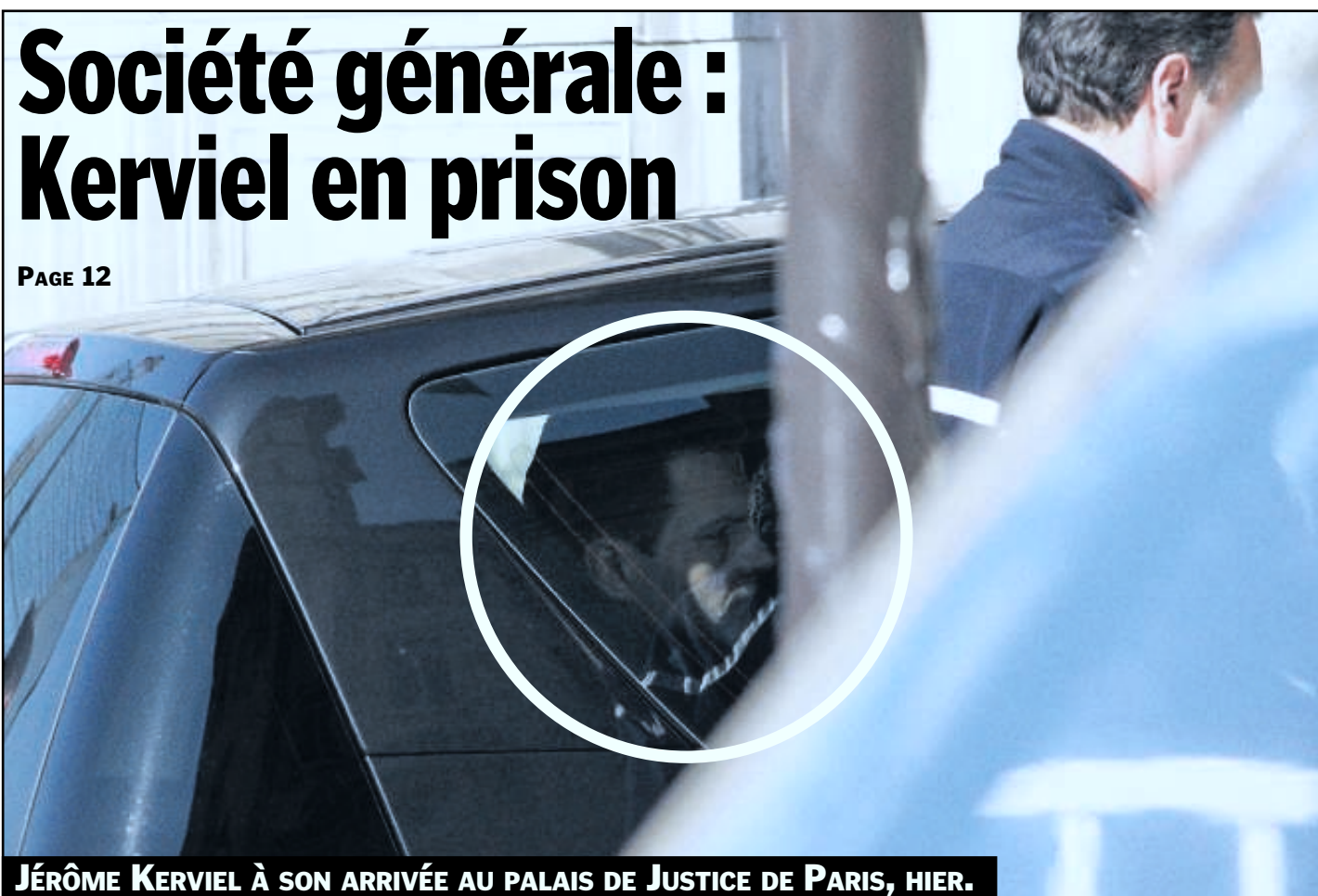
JÉRÔME KERVIEL À SON ARRIVÉE AU PALAIS DE JUSTICE DE PARIS, HIER.