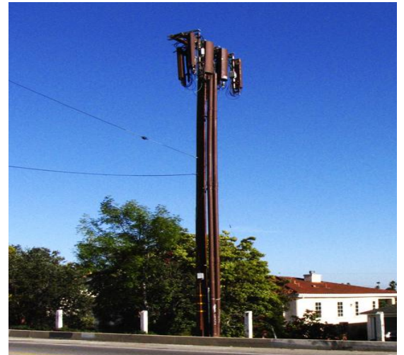
Pylône d'antennes relais (phone mast) à Los Angeles

Il est intéressant de constater que pendant la même période Charlie Crist , gouverneur de Floride, Jodi Rell , gouverneur du Connecticut et Bill Ritter , gouverneur du Colorado ont déclaré le moi de mai 2009 «Mois de la prise de conscience de l'Électro Hyper Sensibilité(EHS)».