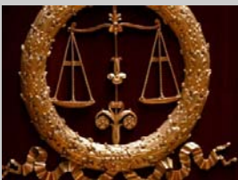
TGI de NANTERRE JUGEMENT

Dans le Code pénal, l'article de loi consacré aux risques causés à autrui, en vigueur depuis 2002, porte le numéro... 223. Le voici : « Le fait d'exposer directement autrui à un risque immédiat de mort ou de blessures de nature à entraîner une mutilation ou une infirmité permanente par la violation manifestement délibérée d'une obligation particulière de sécurité ou de prudence imposée par la loi ou le règlement est puni d'un an d'emprisonnement et de 15 000 E d'amende. » Ça donne à réfléchir!