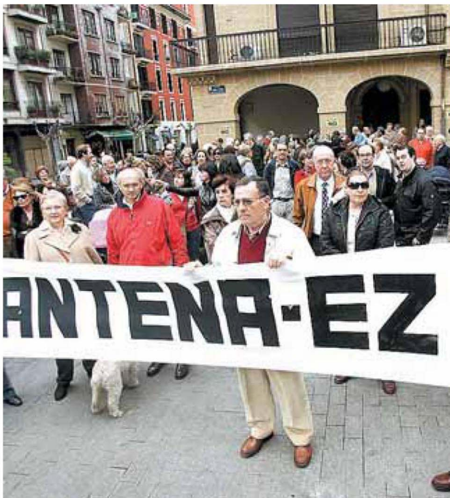
Residentes portan una pancarta en rechazo de la instalación.

Ayuntamiento. Lleva presentada un mes, pero denuncian que "estuvo funcionando de manera clandestina". Ayer, medio centenar de vecinos se manifestaron de nuevo por temor a los efectos biológicos de las antenas.