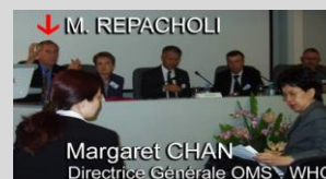
Margaret CHAN Directrice Générale OMS - WHO