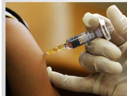
¿ A cuántas generaciones esta acción afectará?

Primeras difusiones en salas en los EE.UU a principios de 2010.