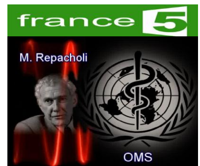
Reportage HD : OMS, Repacholi, Les antennes relais de la colère

Il y a d'ailleurs longtemps qu'en plus d'être un négationniste Repacholi ne se rend plus compte de la portée de ses actes et déclarations, notamment lors de son auditions par-devant les Sénat Australien.