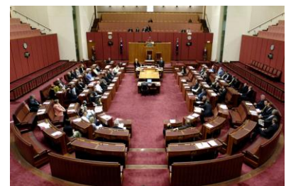
L'hémicycle du Sénat Australien

Le 31 août 2000 devant le Sénat australien, à la question du président du Sénat Sen Lyn Allison, sic : "La nouvelle norme est-elle basée sur la science ?", Repacholi a répondu sous serment, sic : ". . . La norme a été développée principalement sur la base de la norme internationale de cette époque et elle suit cette norme à l'exception d'une région appelée la région des micro-ondes. Il y avait tant de mécontentements à ce propos que le niveau a fini par être négocié. Cela n'a pas été basé sur la science. Tout avait été basé sur la science jusqu'à maintenant, mais la dernière partie n'a pas été basée sur la science, elle a été négociée entre les syndicats (industriels) et le gouvernement de cette époque. "