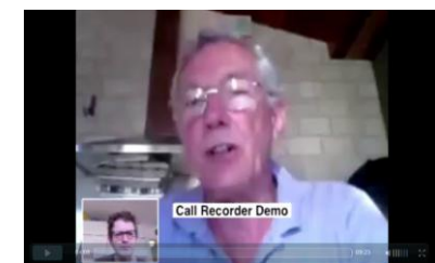
Vidéo (UK) de la déclaration de Repacholi aux médias norvégiens