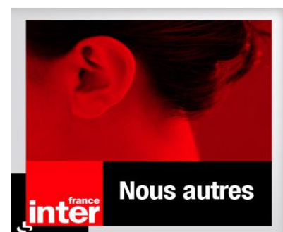
France inter [MP3]: Témoignages, c'est quoi l'Electro Hyper Sensibilité, BioInitiative, les enjeux économiques