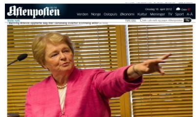
- Gro har skapt strålefrykt i befolkningen