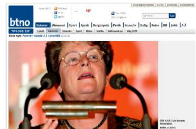
- Gro har skapt strålefrykt i befolkningen