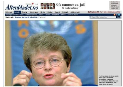
- Gro har skapt mobilfrykt i befolkningen