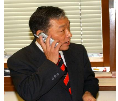
Lee Jong-Wook DG OMS [Dossier]

[Dossier explicite sur le décès de Lee Jong-Wook Directeur Général de l'OMS].